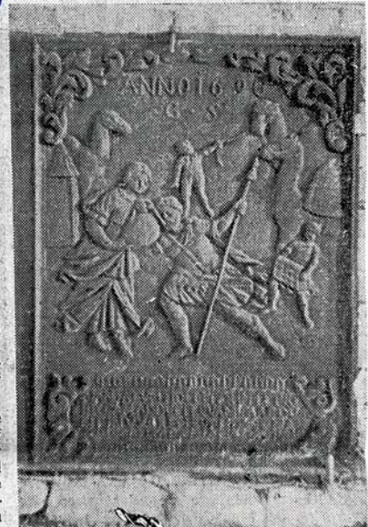
Ofenplatte von 1690 vom Gutshof Lingenbach

So bietet uns der Lingenbacher Hof mit seiner 175jährigen Familientradition einen Beweis für die Zähigkeit, mit der der bergische Bauer an seiner Scholle hängt.